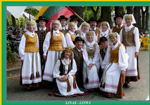
LINAS - LITWA