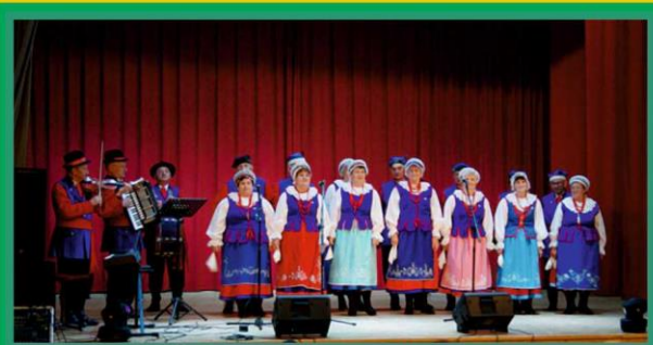
ZESPÓŁ „KUJAWY BACHORNE NOWE” - OSIĘCINY