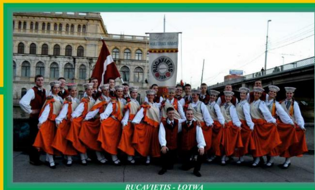
RUCAVIETIS - LOTWA