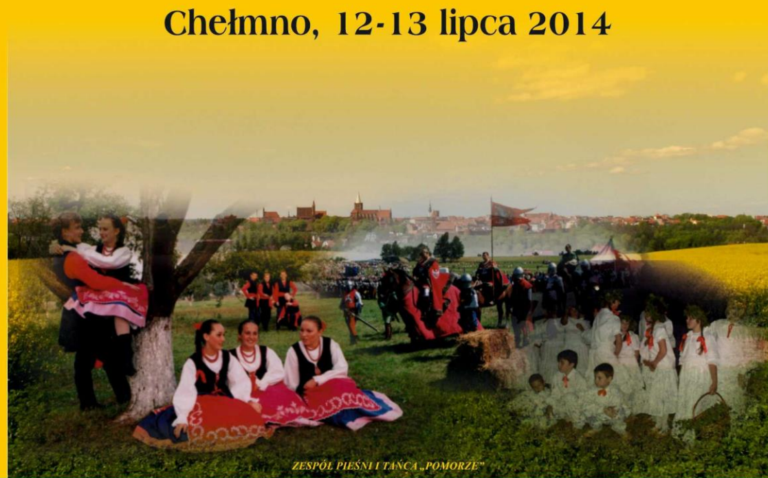
ZESPÓŁ PIEŚNI I TAŃCA „POMORZE”

chełmo.com.pl INTERNETOWY SERWIS INFORMACYJNY