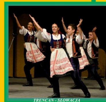
TRENCAN - SŁOWACJA