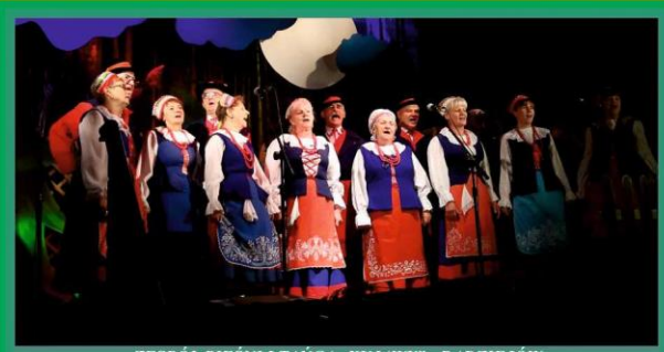
ZESPÓŁ PIEŚNI I TAŃCA „KUJAWY” - RADZIEJÓW