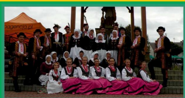
ZESPÓŁ PIEŚNI I TAŃCA „POREBIANIE” - BRZESKO